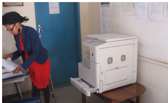
De kopieermachine is reeds volop in gebruik