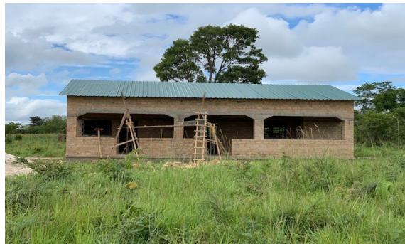
Kliniek in Mwomboshi